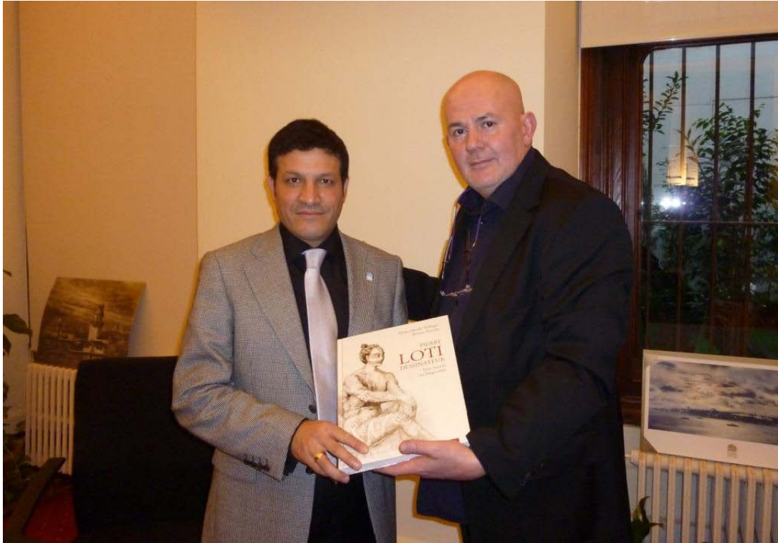
Mr Yılmaz KÜRT - General Secretary, Istanbul 2010 European Capital of Culture